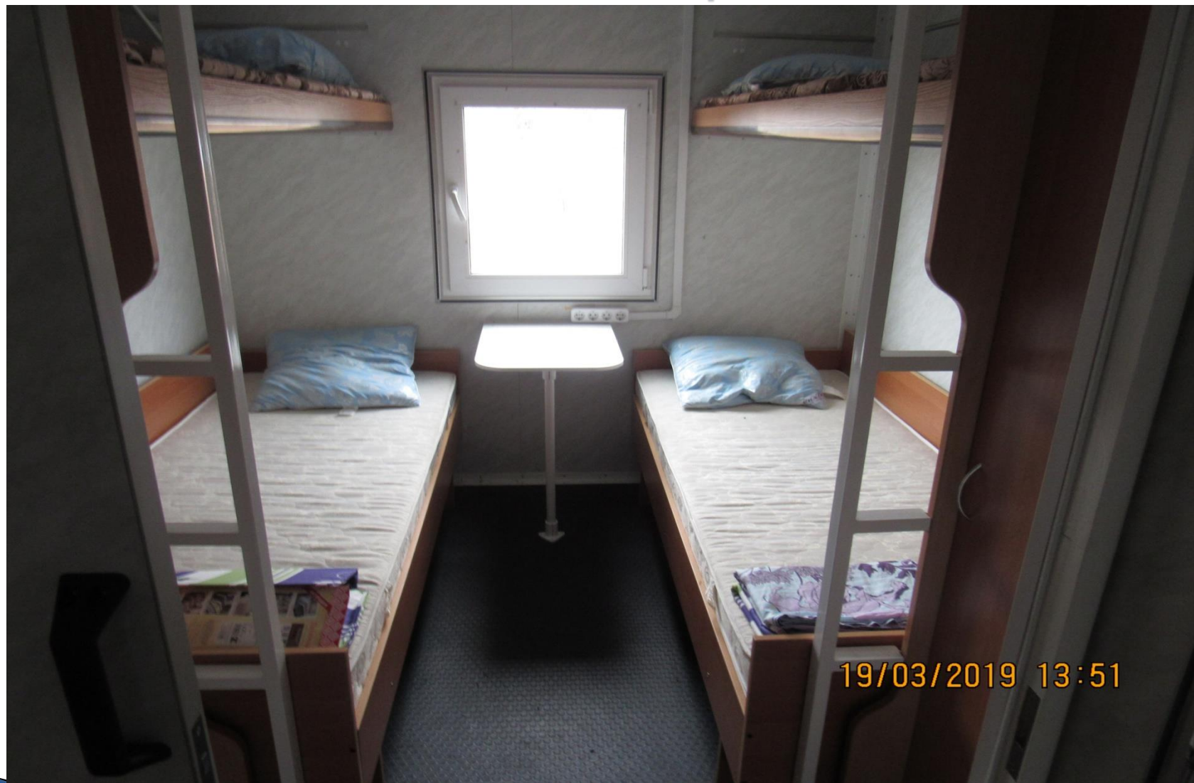
Мобильный дом (8 мест)