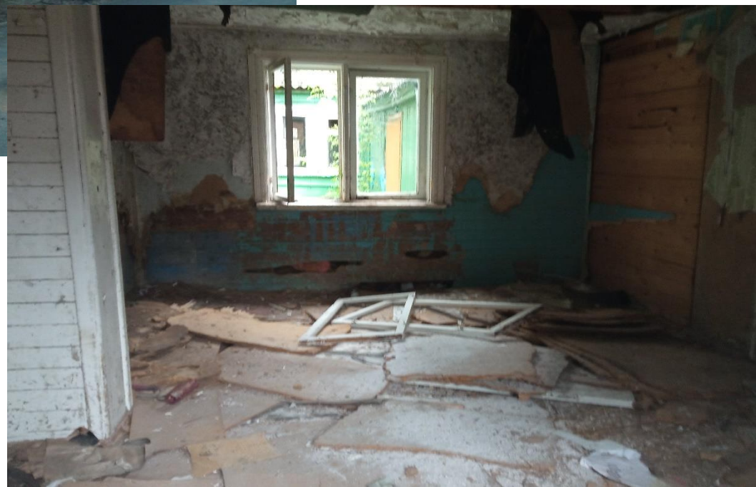
Неиспользуемые 4-е домика на территории эко-туристического центра «Уречье»