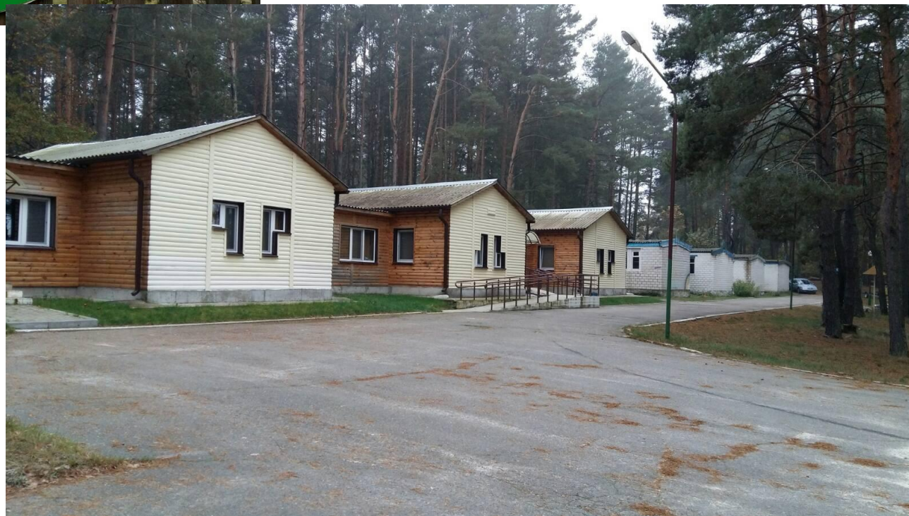
Эко-туристическая база «Уречье»