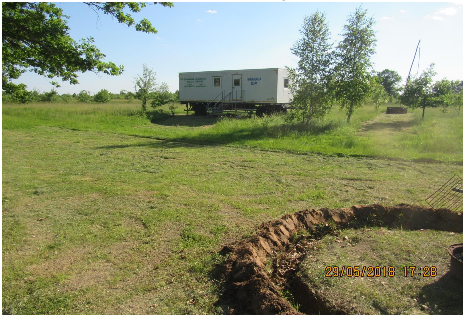
Мобильный дом (8 мест)